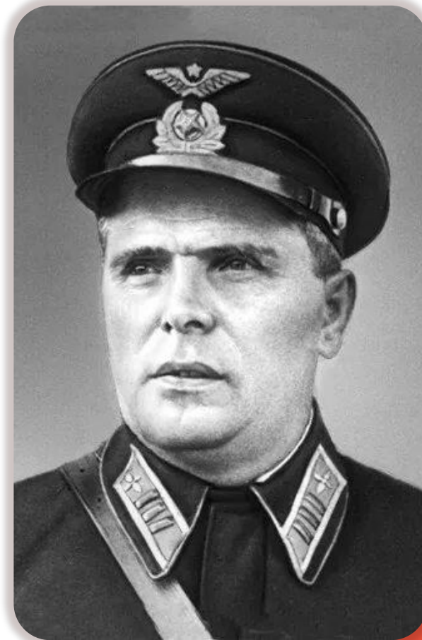
МИХАИЛ ВАСИЛЬЕВИЧ ВОДОПЬЯНОВ (1899–1980)

В честь М. В. Водопьянова названы улицы в Москве, Липецке и других городах. В Москве на Ходынском поле в 2013 году установили памятник летчику Михаилу Васильевичу Водопьянову.